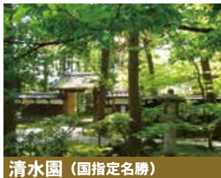
清水園(国指定名勝)