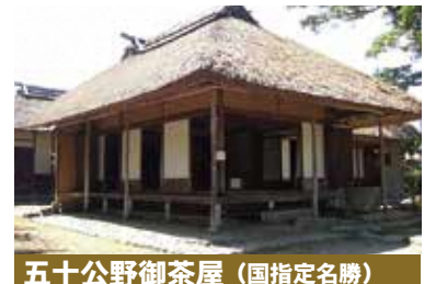
五十公野御茶屋(国指定名勝)

200年に渡る酒造りの歴史と全国屈指の大地主市島家の収蔵品を展示。日本酒の無料試飲券プレゼント！