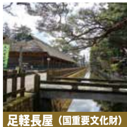
足軽長屋(国重要文化財)